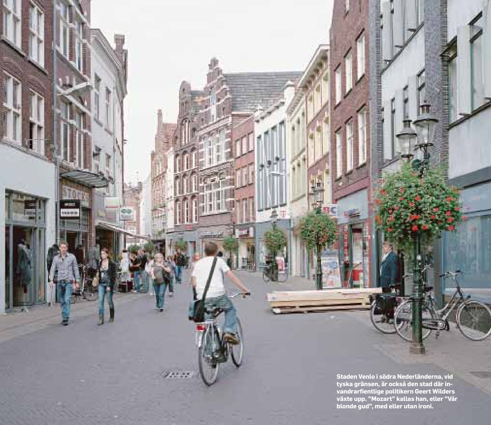
Staden Venlo i södra Nederländerna, vid tyska gränsen, är också den stad där invandrarfientlige politikern Geert Wilders växte upp. "Mozart" kallas han, eller "Vår blonde gud", med eller utan ironi.