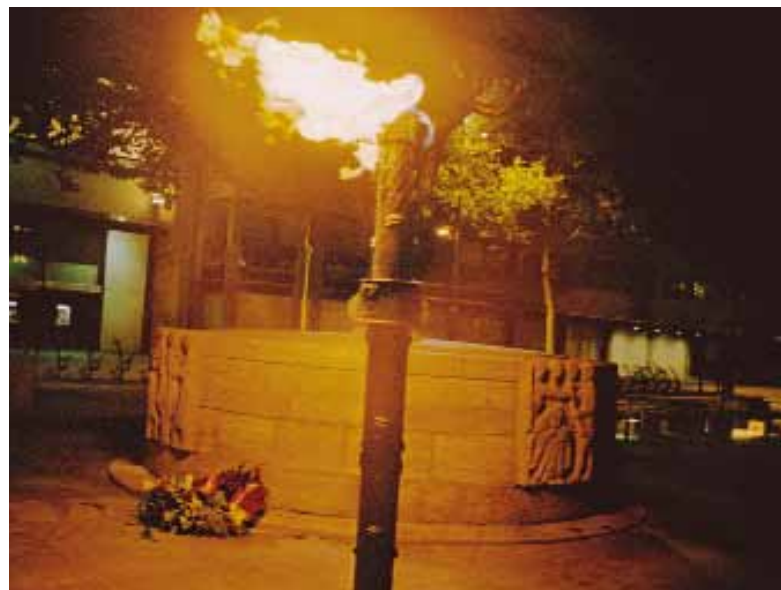
Här börjar "lichtjesstraat". Facklan brinner dag och natt för att fira befrielsen från den tyska ockupationen.