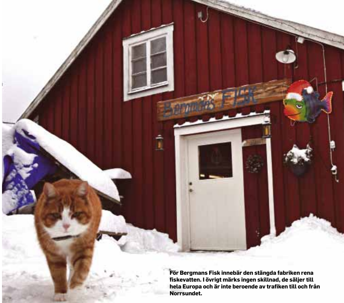
För Bergmans Fisk innebär den stängda fabriken rena fiskevatten. I övrigt märks ingen skillnad, de säljer till hela Europa och är inte beroende av trafiken till och från Norrsundet.

Solcellerna, vad hände med dom? Alla undrar. Det sades att Norrsundet skulle tillverka solceller, att folk skulle få jobb. Sen skulle man återvinna gamla gummidäck. Norrsundets företagscenter bildades och skulle locka till sig nya företag genom att peka på havsutsikten, det exklusiva läget. Den perfekta platsen för upplevelseindustrin. Varför inte bygga om brukets gamla bassänger till dammar för fisketurism? Det snackades vitt och brett, stort och ännu större, det skulle komma in hur många räddare som helst. Men det enda som blev var en pelletsfabrik som gav en handfull jobb och ett företag som tog över verkstadsfolket.